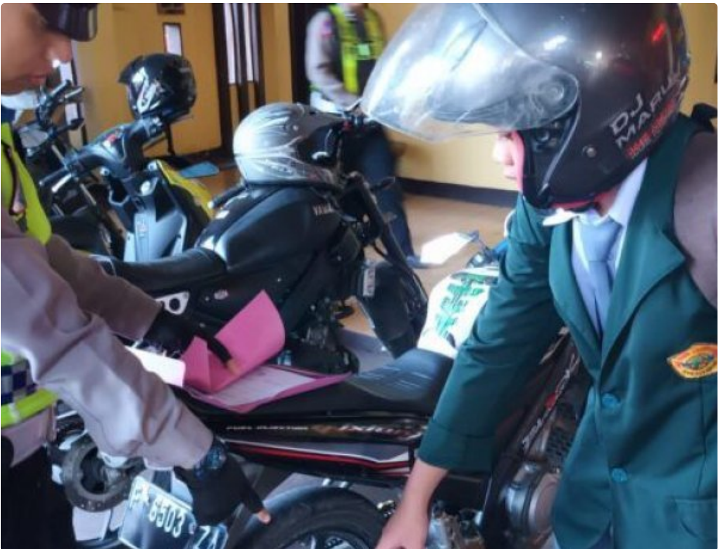
Polsek Cisaat Polres Sukabumi Kota

Kota Sukabumi – Polres Sukabumi Kota Polda Jawa Barat – Unit Lalulintas Polsek Cisaat Polres Sukabumi Kota setiap hari, melaksanakan sosialisasi dan penertiban knalpot brong atau knalpot tidak sesuai dengan spesifikasi Hal ini untuk mencegah penggunaan knalpot brong dikalangan pelajar, Selasa