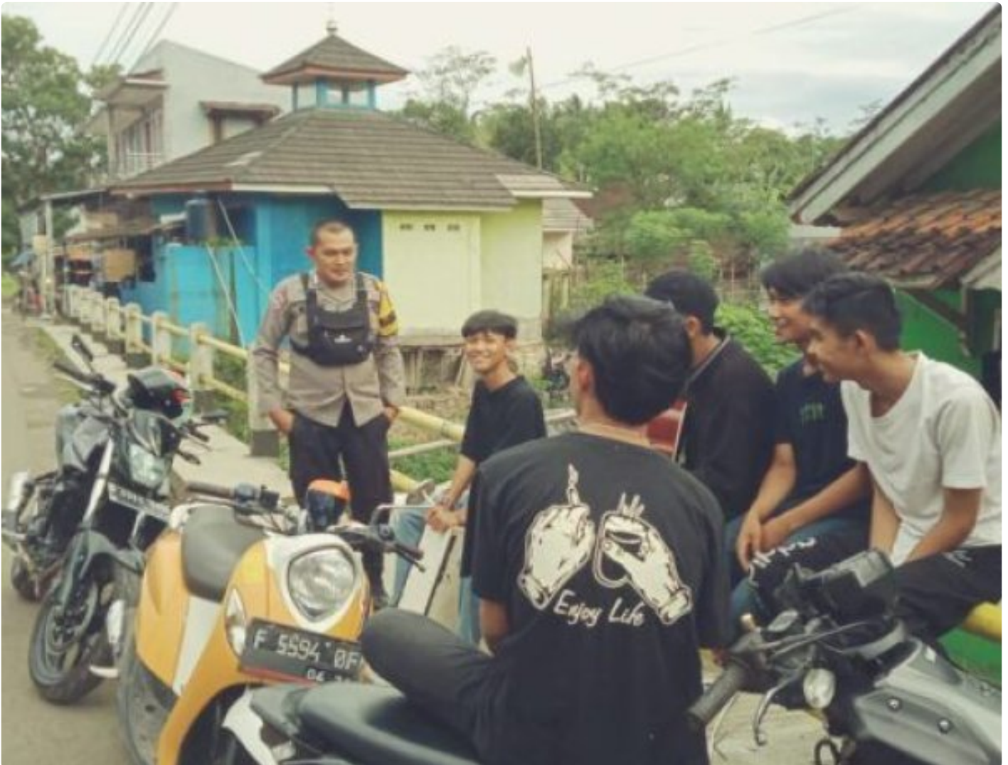
Polsek Cireunghas Polres Sukabumi Kota

Kota Sukabumi – Polres Sukabumi Kota Polda Jawa Barat – Polsek Cireunghas melaksanakan kegiatan dialogis dengan para pengemudi angkutan umum di jalan sempur, Selasa (30/1/24). Kegiatan ini bertujuan untuk menyampaikan himbauan kamtibmas kepada para pengemudi dan meningkatkan kerja sama antara